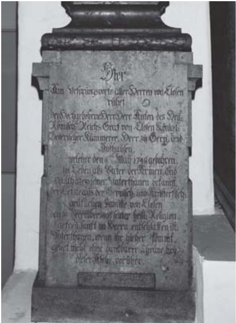
Text auf dem Epitaph des Grafen Anton von Closen in der Heilig-Kreuz-Kirche in Landau/Isar mit dem geheimnisvollen Hinweis auf den Ursprung des uralten Adelsgeschlechts.