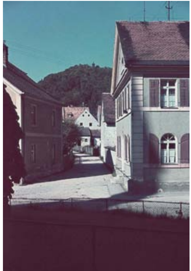
Mesnergasse mit Pfarrhof im Vordergrund rechts, links das alte Mesnerhaus bzw. jetzt das Pfarrzentrum