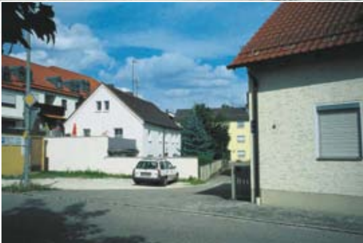
Schneitweger Straße „am Kobl“ – hier befand sich einmal das Regen- stauffer Gefängnis