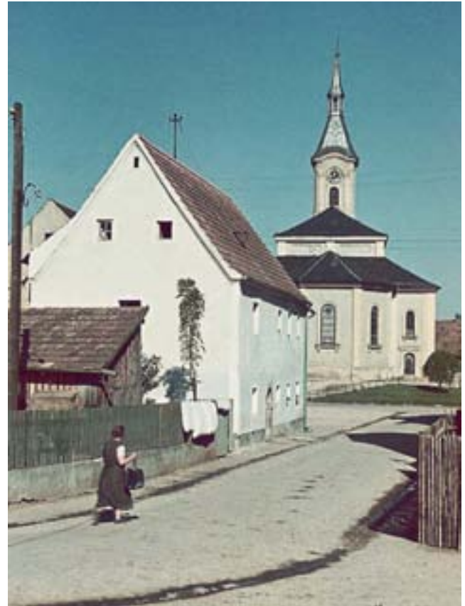
Blick von der Hauzensteiner Straße zum Kirchplatz