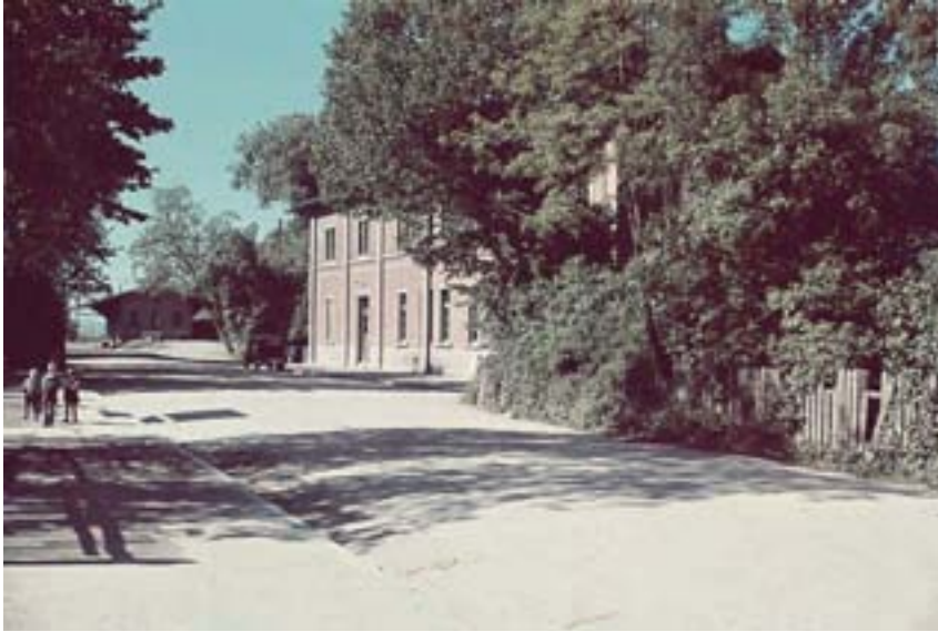
Auf dem alten Foto ist hinter dem Bahnhof noch die Güterhalle zu sehen.