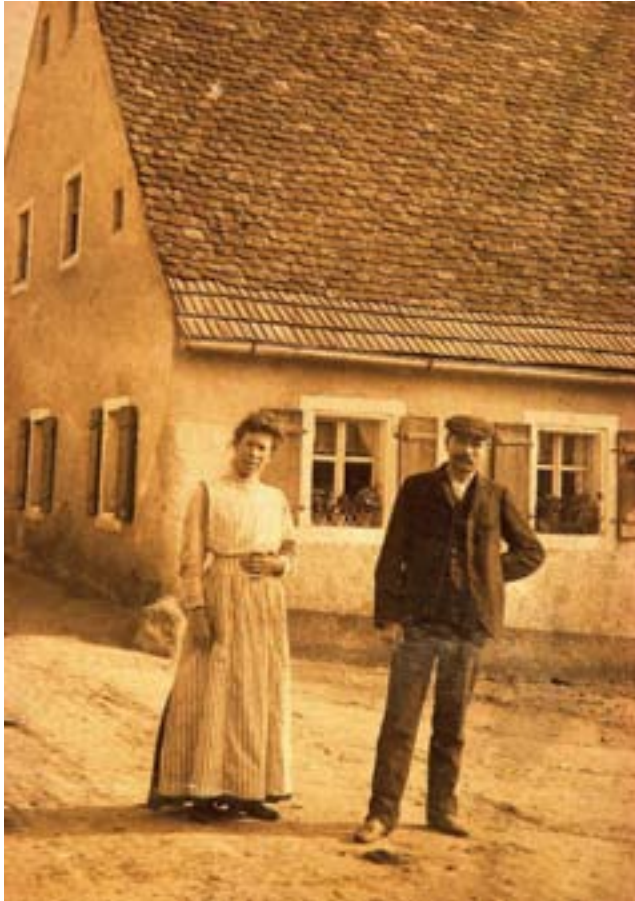
Amannstraße mit dem früheren Schmatzhaus ca. 1909, jetzt Ganslmeieranwesen