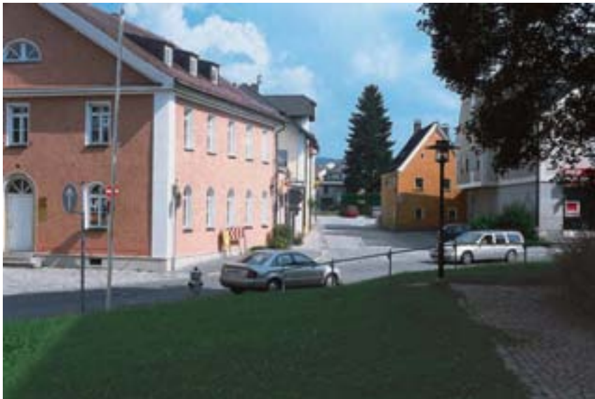
Pfarrhof der Pfarrei St. Jakob