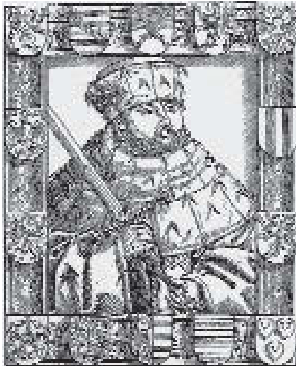
Johann Friedrich der Großmütige (Holzschnitt Lukas Cranach d.J. um 1540)

Er wurde am 30. Juni 1503 in Torgau geboren als Sohn Johann des Beständigen. Bereits 1532 übernahm er nach seines Vaters Tod die Regierung Kursachsens und wur-