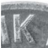
a) neuer Stempel

Grundsätzlich unterscheiden sich die Stempel dadurch, daß die alten Werkzeuge deutlicher sichtbare Reliefs mit tiefer ausgeschnittenem Profil hinterließen. Bei den Pfennig-Werten finden sich die deutlichsten Veränderungen auf der Wertseite – die Körner in den Ähren sind rundlicher und viel körniger als beim neuen Stempel. Hier imponieren die Körner wesentlich schlanker und gestreckter. Auch die Buchstaben des Wortes Pfennig sind viel schlanker, am besten am „I“ zu erkennen. Die Schenkel des „K“ in dem Wort Bundesrepublik auf der anderen Seite treffen spitz am Stamm zusammen und sitzen nicht mehr breitbasig auf.