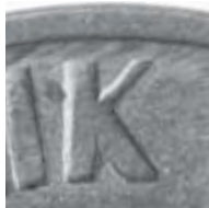
b) alter Stempel