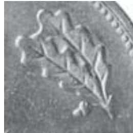
b) alter Stempel