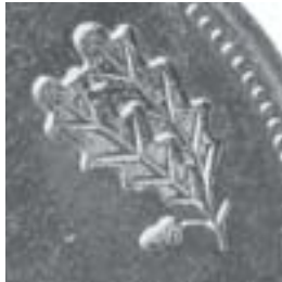
a) neuer Stempel

Bei den Markstücken sind die rechtsseitigen Eichenblätter auf der Wertseite anders geschnitten, es findet sich eine kleine Einbuchtung am oberen Teil des unteren Blattes. Der Adler zeigt veränderte Details, z. B. sind die Krallen der Füße etwas stärker gekrümmt.