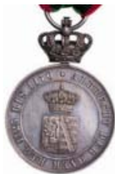
25 Silberne Verdienstmedaille mit Krone S 360,-