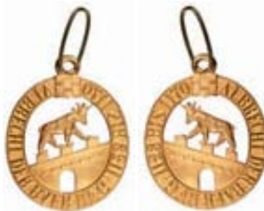
Ex. in Gold