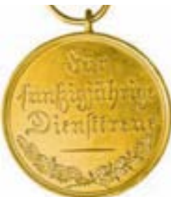
49 Medaille für 50jährige Dienstreue in Gold (1835–1863)