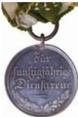
50 wie vor, silberne Medaille (1843–1863)