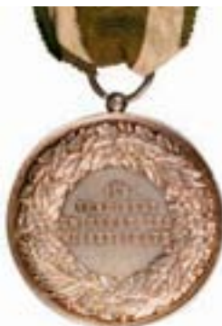
48 wie vor, silberne Medaille