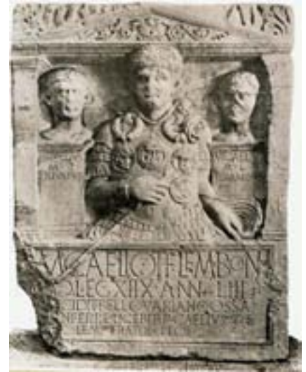
Grabstein des Legaten Marcus Caelius, Centurio der XVIII. römischen Legion, gestorben 9 n. Chr. in der Varusschlacht