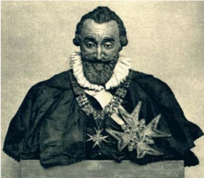
König Heinrich IV. von Frankreich mit den Insignien des Ordens vom Hl. Geist. Wachsbüste nach dem Leben. Museum Fridericianum – Hessisches Landesmuseum, Kassel

Die Reihe der ruhmvollen weltlichen Ritterorden lässt sich reichhaltig fortsetzen. Unbedingt genannt werden müssen noch der: