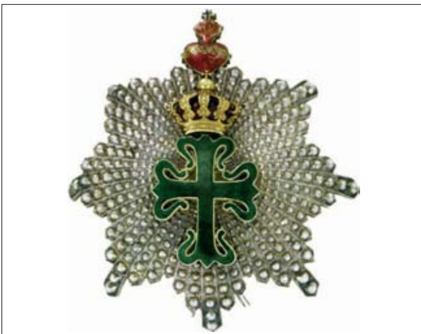
Portugal: Militär-Orden St. Bento d'Aviz, 1162 – heute. Bruststern zum Kommandeurkreuz 2. Klasse mit der Herz-Jesu-Dekoration. Hersteller: Da Costa, Lissabon, um 1900

F 4 Orden des Hl. Grabes, 1099 nach der Erstürmung von Jerusalem gestiftet, Ritter des Ordens, rechts daneben ein Ritter des Hl. Lazarus