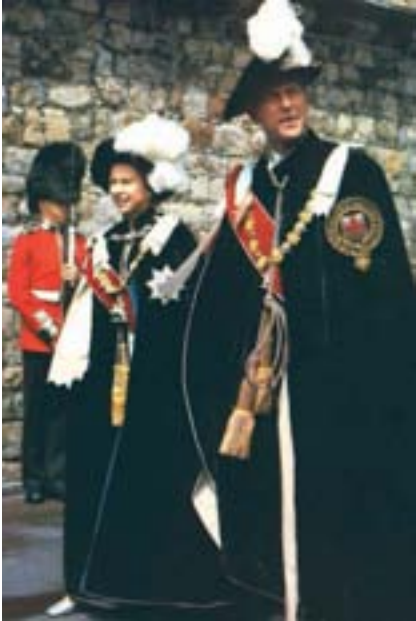
Die englische Königin Elisabeth II. und Philipp, Herzog von Edinburgh, bei der Garter Zeremonie auf Windsor Castle im traditionellen Ornat des Hosenbandordens.

zeichen, dessen ganzer Werth eben nur ein moralischer ist? Und doch weiß, wer die Geschichte der Menschheit kennt, welcher ungeheurer Einfluss diese Ehrenzeichen, diese Bänder, Kreuze, Sterne, mit einem Worte, die Orden auf die Entfaltung hoher Gesinnung, auf die Vollbringung kühner und tapferer Thaten, auf die Erreichung fernstehender, unmöglich erachteter Ziele haben. Und dies zu allen Zeiten. Die Mauerkronen und Lorbeerkränze haben auf den Römer gewirkt, wie das goldene Vlies auf den Ritter des Mittelalters, wie in der neuen Zeit das Ehrenkreuz auf den Soldaten.“