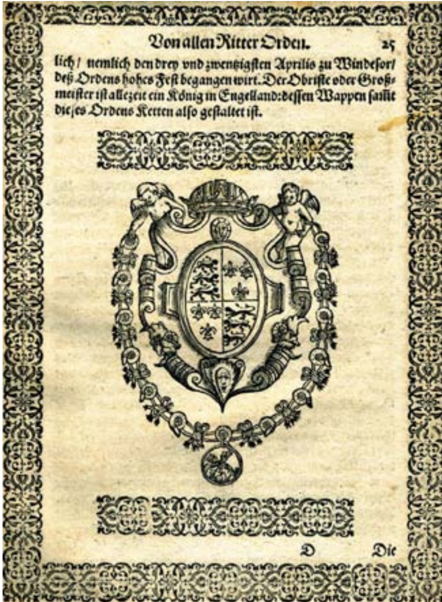
Beschreibung vom „Orden deß Hosenbändels“ von Hieronymus Megiser, 1593, mit Darstellung der Ordenskette

deten Anekdote, die mit der Würde des Hosenbandordens unvereinbar ist“. Aber dann, 1948, am Tage des Sechshundertjährigen Jubiläums des Hosenbandordens, geschieht etwas Unerwartetes. Die respektable Londoner „Times“ erscheint mit einem langen Artikel, in dem aufgrund neuester historischer Untersuchungen ein Schlusstrich gezogen wird: Ja, es ist, wie es die volkstümliche Version erzählt; das Strumpfband der Gräfin von Salisbury ist der Anlass zur Gründung des Hosenbandordens. Gleichzeitig wird in diesem Artikel die vielumstrittene Gestalt der Gräfin von Salisbury mit einer anderen Persönlichkeit der englischen Geschichte identifiziert: mit Johanna, der „holden Maid von Kent“, einer Enkelin König Edwards I., die eine Schönheitskönigin ihrer Zeit gewesen sein muss und später die Gattin des „Schwarzen Prinzen“ und damit erste Prinzessin von Wales wurde.