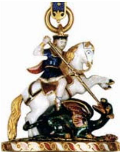
Kleinod von der Kollane des Hosenbandordens, 1348 – heute

So lautet die volkstümliche Version von der Entstehung des ehrwürdigen Hosenbandordens und seines ungewöhnlichen Wahlspruches. Sie klingt wie eine romantische Erfindung, und man kann verstehen, dass man sie lange Zeit in das Reich der Legende verweist. Die Geschichtsschreiber sprechen von einer „vulgären Geschichte“ und von einer „romantischen, durch nichts begrün-