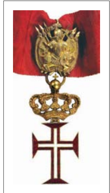
Vatikan / Kirchenstaat Christus-Orden, 1319 – heute, als Fortsetzung des Ordens der Templer ins Leben gerufen. Ausführung mit Waffentrophäe