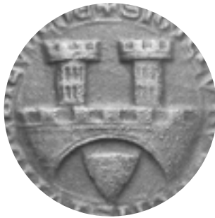
Nr. 192 A Das Siegel der Altstadt um 1270

Die Ratsherren des 13. Jahrhunderts reihen sich vielmehr mit ihrem Siegelbild in die große Gruppe jener Städte ein, bei denen die zwei Elemente der Türme und des Bogens auf Grund ihres symbolhaften Charakters recht häufig mit einem Wappen zu einer Einheit verschmolzen werden. Die Türme stehen für die Wehrhaftigkeit der Stadt, der Torbogen verdeutlicht den Willen der Stadt, sich dem heimischen Bürger zu öffnen. Ergänzt wird das Bild durch das Sparrenschild, das Wappen der Ravensberger.