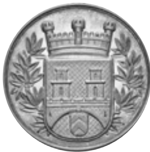
Nr. 25 1891 entwarf der Kreisbau- meister Buschmann das Wap- pen mit der Krone