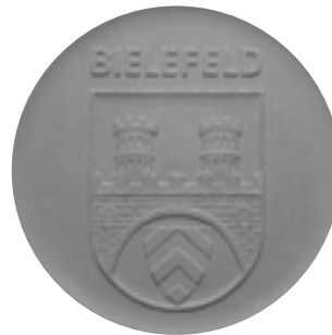
Nr. 137 Das Wappen in seiner heutigen Form gibt es seit dem 19. Juni 1951

Im Laufe der folgenden Jahrhunderte wird das Wappen immer wieder verändert. So kommt es z.B. nach der Vereinigung von Altstadt und Neustadt im Jahre 1522 vor allem zu einer neuen Anordnung der Grundbausteine, die Türme stehen nicht mehr auf dem Mauerbogen, sondern stützen ihn als Stadttor, eine Anlehnung an das Neustadtwappen.