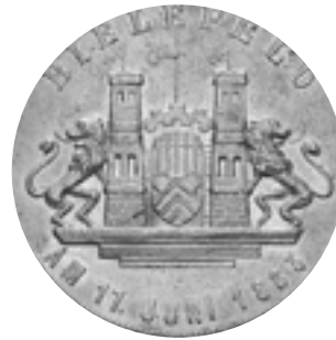
Nr. 13 Ab 1838 stützen 2 Löwen die Türme