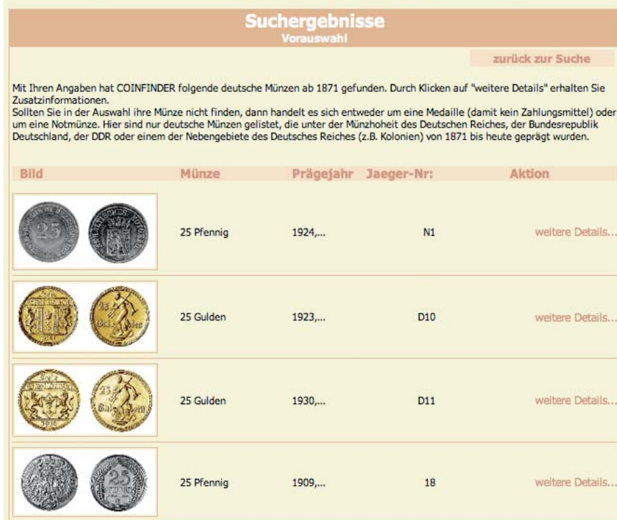
Abb. 2: Suchergebnisse und Vorauswahl

Der Coinfinder kann mit jedem Internetbrowser zuhause am PC aufgerufen werden. Zudem gibt es viele Mobilfunkgeräte, die mittlerweile ganz ordentliche Internetprogramme haben. Allen voran kann man hier das iPhone/iPad von Apple nennen. Mit diesen mobilen Multimedia-Geräten kann man nun jederzeit (z. B. beim Flohmarktbesuch) deutsche Münzen bestimmen und sich Bewertungen anzeigen lassen, ohne nochmals eine APP kaufen zu müssen. Der Münzhandel und weitere Interessierte sind eingeladen, auf diese Seite zu verlinken. Josef Roidl