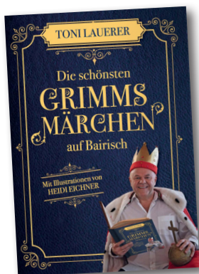
136 Seiten, 17 x 24 cm, durchgehend farbige Abbildungen, Hardcover ISBN: 978-3-95587-719-4; Preis: 19,90 EUR